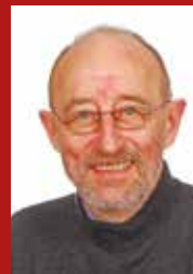
Kaj Ove Steffansen: Regnskab, Legater