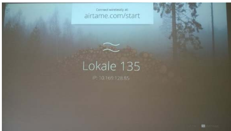
Figur 1 - Projektor billede med lokalenummer og IP på AirTame enheden

Programmet til AirTame er pr default indstillet til at arbejde live billede fra PC til projektor, hvilket betyder at hvis man ønsker at se film eller andet med lyd skal man trykke på den lille højttaler, der er ved siden den tilsluttede enhed, se figur 2. Tilsluttes lyd og billede vil opdateringen fra billedet på skærmen til projektoren ske med en buffer på ca. 2½ sec.